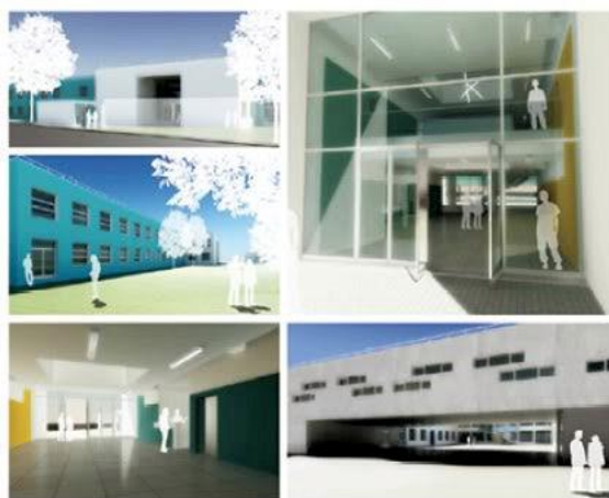
Projeto para a Escola Secundária de Campo Maior, em finalização

O projeto ainda não está concluído, mas de acordo com o projeto a beneficiação e impacto na comunidade educativa será muito positiva, uma vez que os espaços oferecem condições de frequência e aprendizagem adequadas às vivências sociais e tecnológicas dos nossos dias.