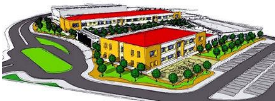
Projeto Centro Escolar