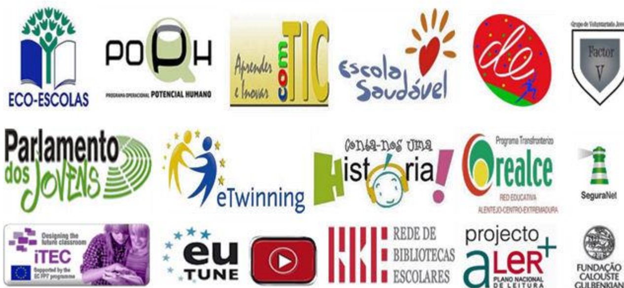
Mosaico de projetos existentes no Agrupamento

A Tabela que se segue apresenta brevemente cada projeto: