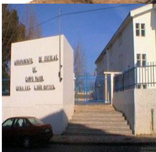
Escolas do 1º ciclo e Escola Básica de São João Baptista